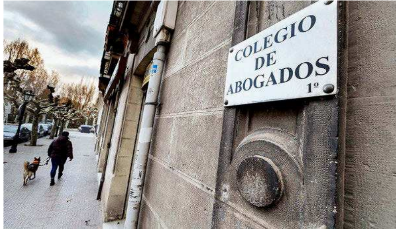
Sede del Colegio de Abogados, en la calle Benito Gutiérrez.

Según los datos recopilados por el personal del Colegio de Abogados de Burgos, ya en marzo, cuando el servicio automatizado de llamadas se implantó en todos los